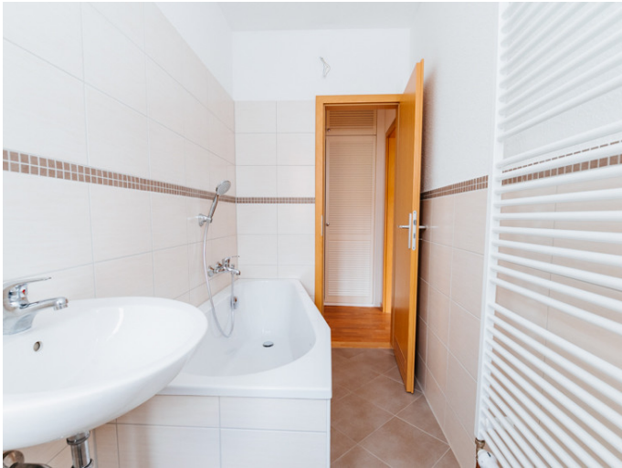
Altstadt Otto-von-Guericke-Str. 84 3R

Die Stadtfelder Wohnungsgenossenschaft eG | Peter-Paul-Straße 32 | 39106 Magdeburg