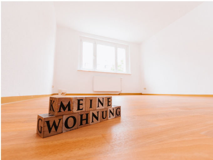
Altstadt Otto-von-Guericke-Str. 84 3R