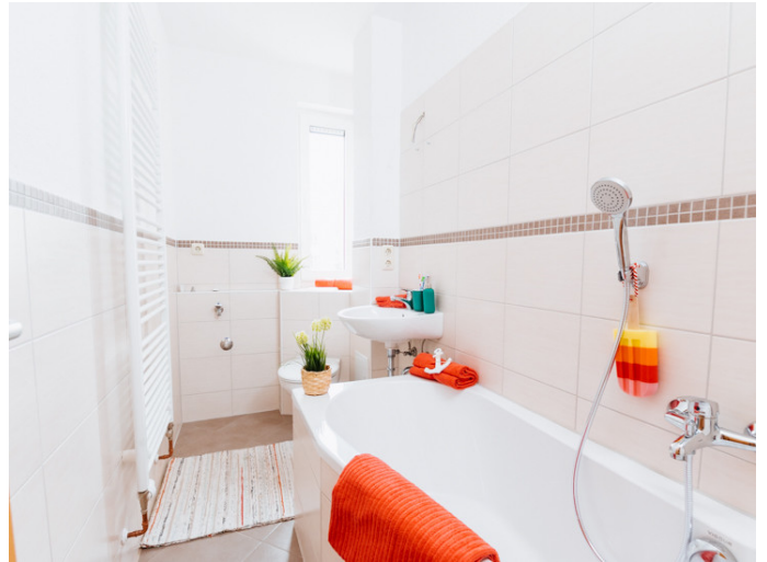
Altstadt Otto-von-Guericke-Str. 84 3R