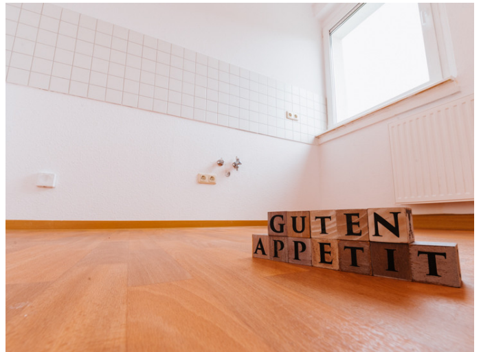
Altstadt Otto-von-Guericke-Str. 84 3R