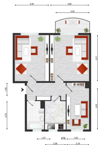
Grundriss möbliert-KI- generiert