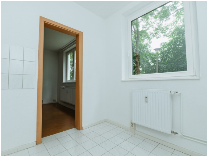
Helle Küche mit Fenster