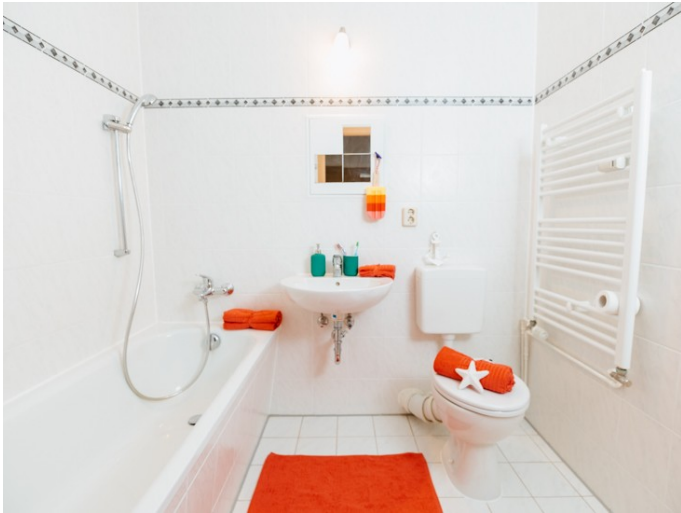
Modernes Badezimmer mit Wanne

Die Stadtfelder Wohnungsgenossenschaft eG | Peter-Paul-Straße 32 | 39106 Magdeburg