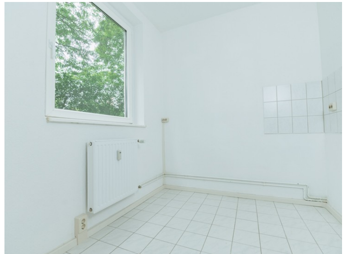
Moderne, Freundliche Küche