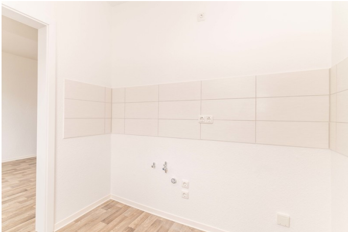
Küche mit Fliesenspiegel