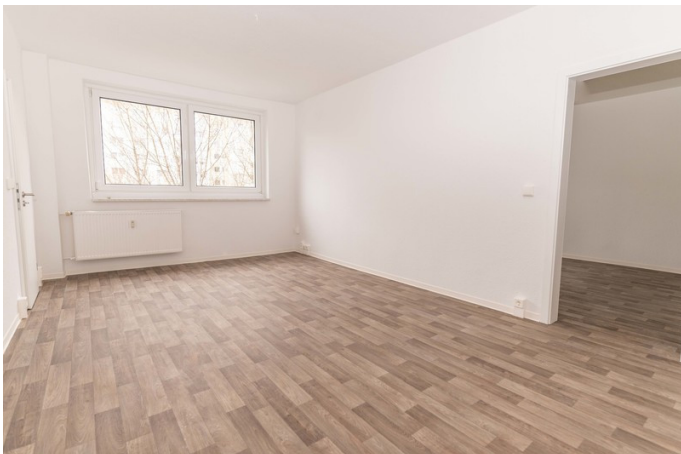
Ihr Zimmer für viele Ideen