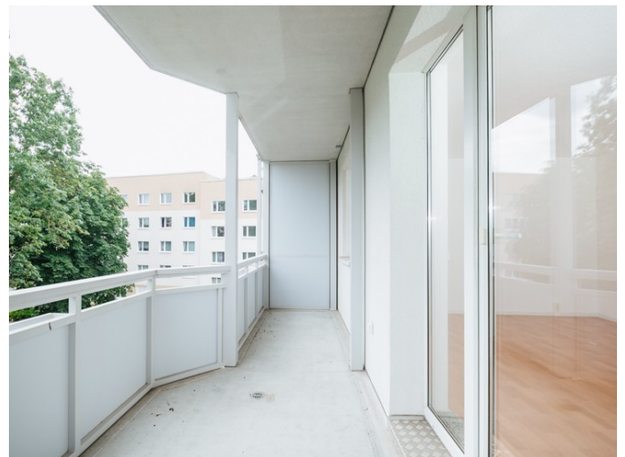
Die Stadtfelder Lion-Feuchtwanger-Str.6_5R