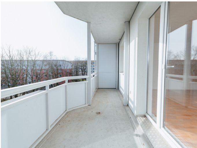
Die Stadtfelder Lion-Feuchtwanger-Str. 16