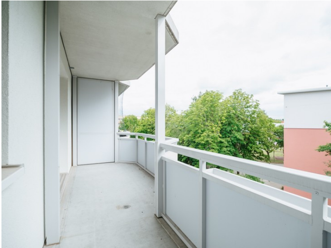
Die Stadtfelder Lion-Feuchtwanger-Str.6_5R

Die Stadtfelder Wohnungsgenossenschaft eG | Peter-Paul-Straße 32 | 39106 Magdeburg