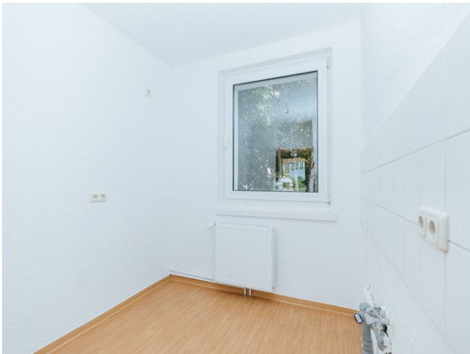
Alte Neustadt Alemannstr. 3