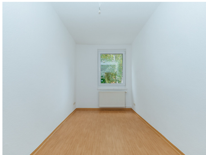
Alte Neustadt Alemannstr. 3