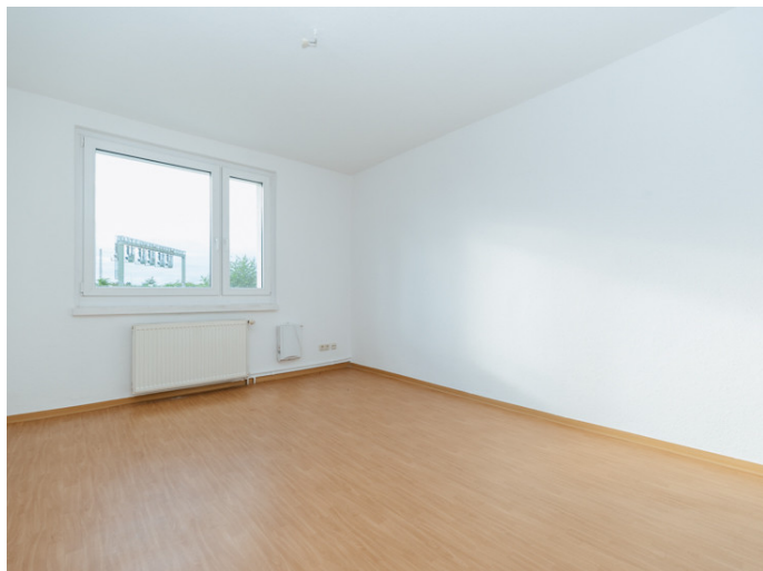
Alte Neustadt Alemannstr. 3

Die Stadtfelder Wohnungsgenossenschaft eG | Peter-Paul-Straße 32 | 39106 Magdeburg