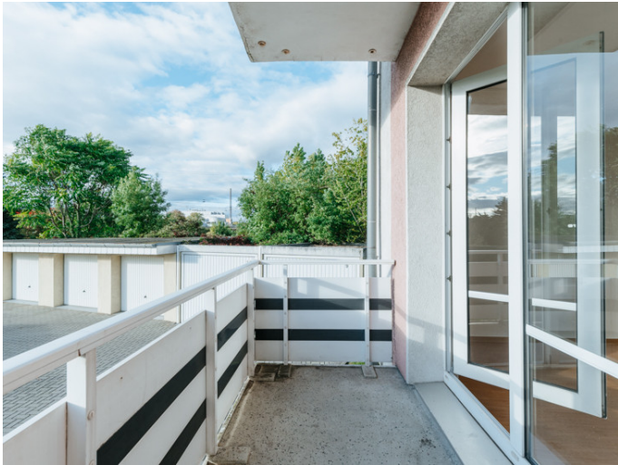
Alte Neustadt Alemannstr. 3

Die Stadtfelder Wohnungsgenossenschaft eG | Peter-Paul-Straße 32 | 39106 Magdeburg