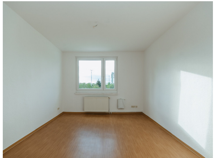
Alte Neustadt Alemannstr. 3