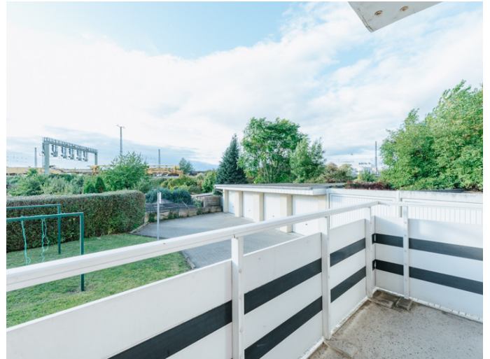
Alte Neustadt Alemannstr.