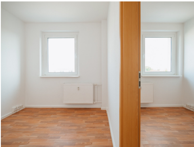
Leipziger Strasse Bernhard-Kellermann-Str. 32_5R