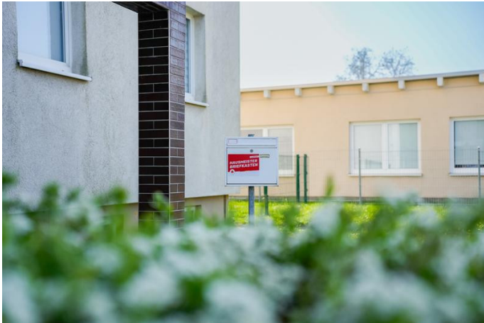
Ferdinand-von Schill-Straße 25-31

Die Stadtfelder Wohnungsgenossenschaft eG | Peter-Paul-Straße 32 | 39106 Magdeburg