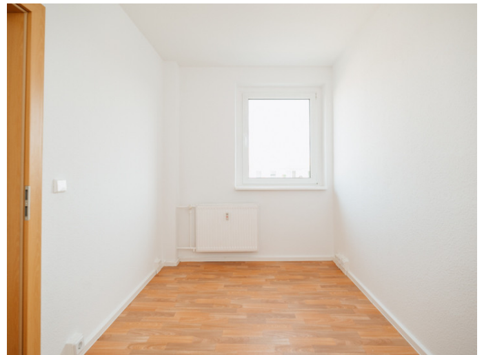
Leipziger Strasse Bernhard-Kellermann-Str. 32_5R