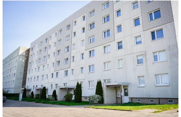
Ferdinand-von Schill-Straße 25-31