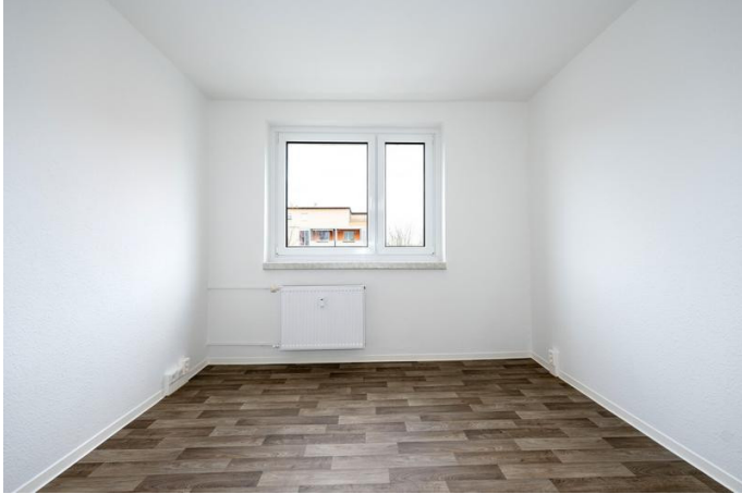
Innenaufnahme - Wohnen 2

Die Stadtfelder Wohnungsgenossenschaft eG | Peter-Paul-Straße 32 | 39106 Magdeburg