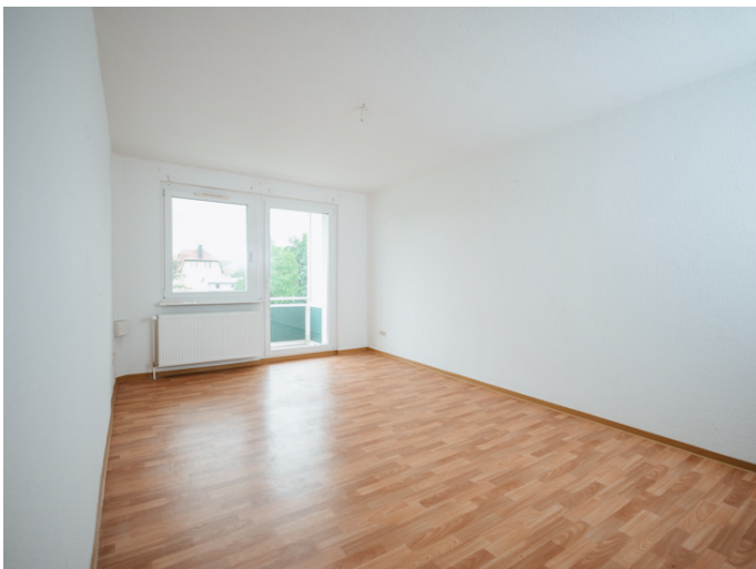
Neue Neustadt Kastanienstr. 35_3R Ihre neue Traumwohnung bei der DSW