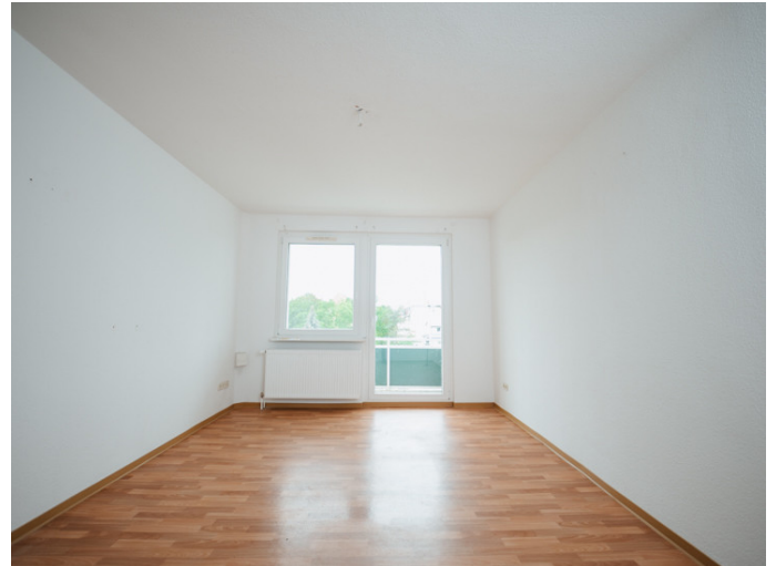
Neue Neustadt Kastanienstr. 35_3R Ihre neue Traumwohnung bei der DSW