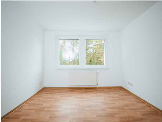
Neue Neustadt Kastanienstr. 35_3R Ihre neue Traumwohnung bei der DSW

Die Stadtfelder Wohnungsgenossenschaft eG | Peter-Paul-Straße 32 | 39106 Magdeburg