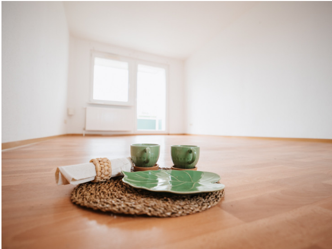
Neue Neustadt Kastanienstr. 35_3R Ihre neue Traumwohnung bei der DSW

Die Stadtfelder Wohnungsgenossenschaft eG | Peter-Paul-Straße 32 | 39106 Magdeburg