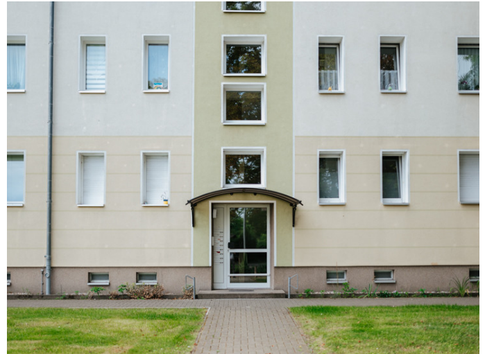
Neue Neustadt - Kastanienstr. 35