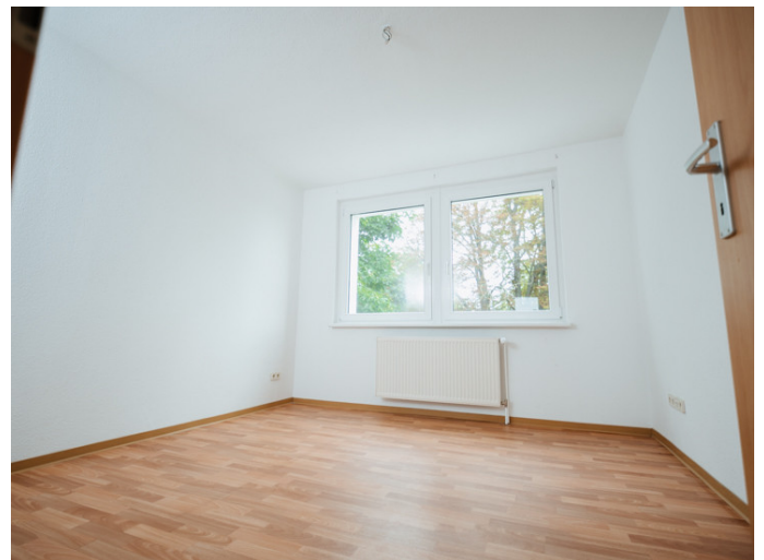
Neue Neustadt Kastanienstr. 35_3R Ihre neue Traumwohnung bei der DSW