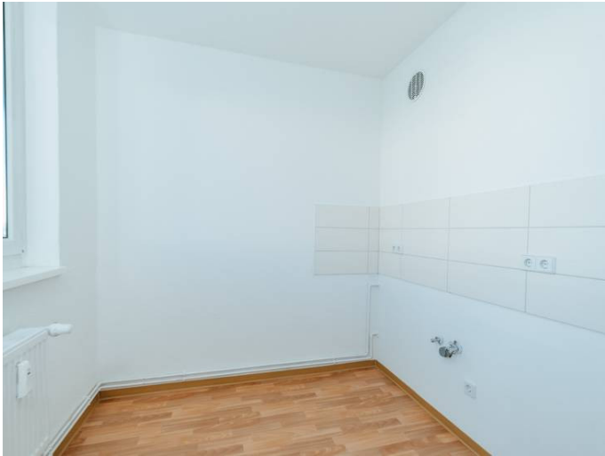
Die Stadtfelder Dr-Grosz-Str._6_5ML_102_105

Die Stadtfelder Wohnungsgenossenschaft eG | Peter-Paul-Straße 32 | 39106 Magdeburg