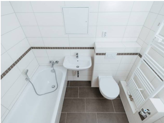
Die Stadtfelder Dr-Grosz-Str._6_5ML_102_105