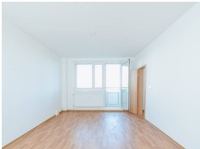
Die Stadtfelder Dr-Grosz-Str._6_5ML_102_105

Die Stadtfelder Wohnungsgenossenschaft eG | Peter-Paul-Straße 32 | 39106 Magdeburg