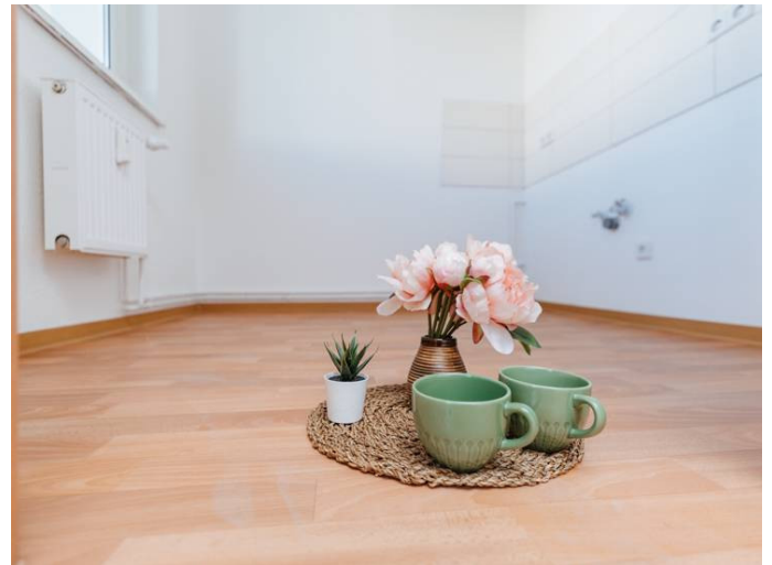
Die Stadtfelder Dr-Grosz-Str._6_5ML_102_105