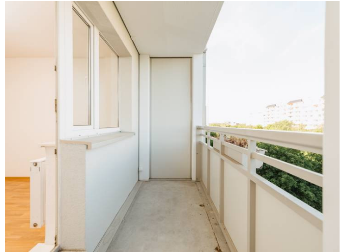
Die Stadtfelder Dr-Grosz-Str._6_5ML_102_105