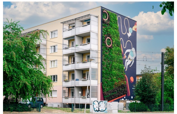
Unsere Grüne Wand