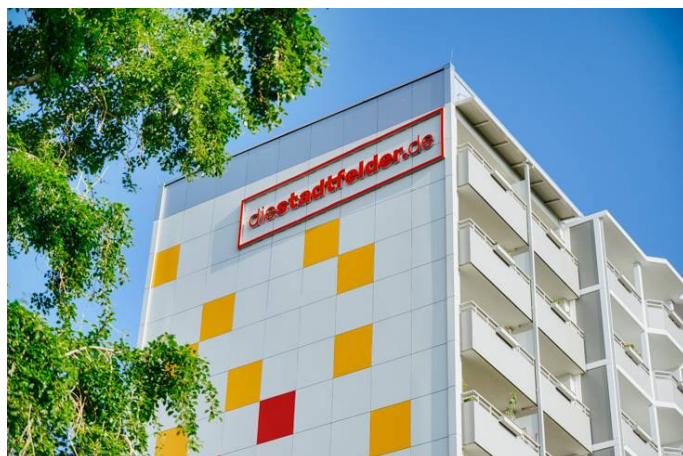
Die Stadtfelder Dr.Grosz_Str._Aussen