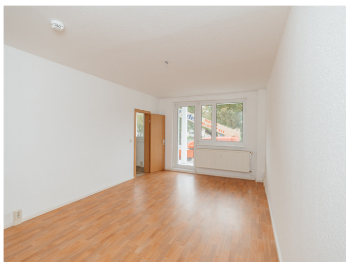
Neustädter See Dr. Grosz-Str. 5 1ML