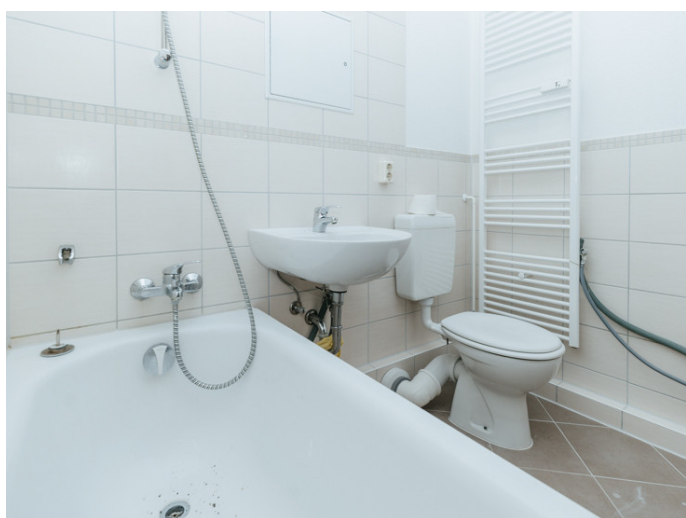
Neustädter See Dr. Grosz-Str. 5 1ML