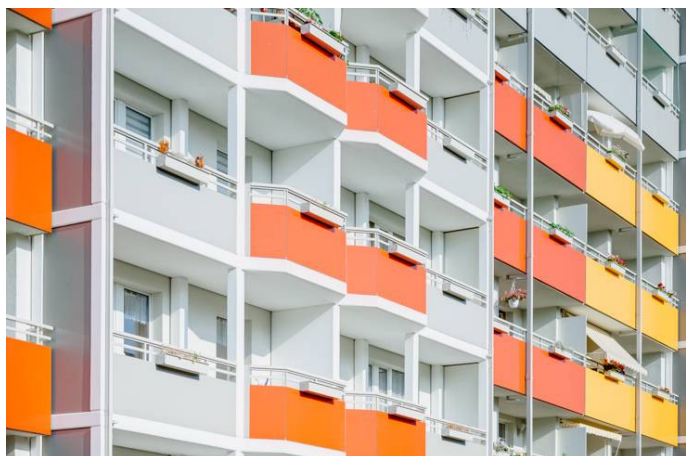
Die Stadtfelder Dr.Grosz_Str._Aussen

Die Stadtfelder Wohnungsgenossenschaft eG | Peter-Paul-Straße 32 | 39106 Magdeburg