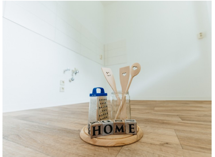
Ihr neues Zuhause