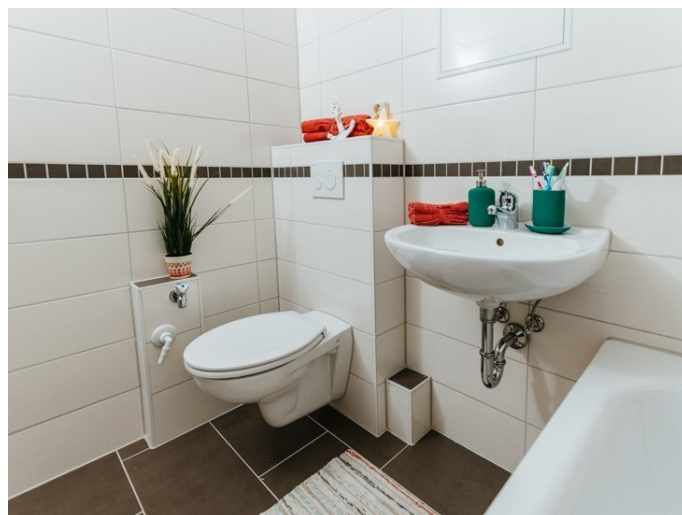
Ihr neues Zuhause