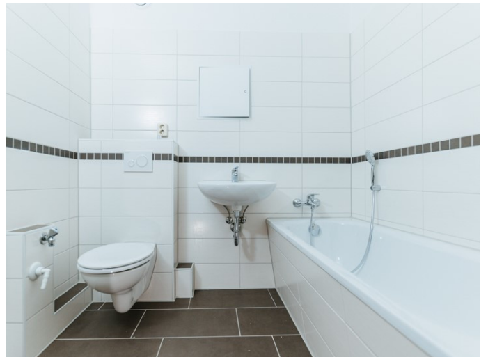
Ihr neues Zuhause