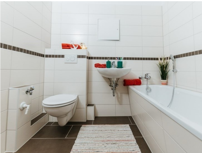
Ihr neues Zuhause