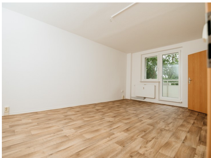
Ihr neues Zuhause

Die Stadtfelder Wohnungsgenossenschaft eG | Peter-Paul-Straße 32 | 39106 Magdeburg