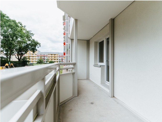
Ihr neues Zuhause

Die Stadtfelder Wohnungsgenossenschaft eG | Peter-Paul-Straße 32 | 39106 Magdeburg