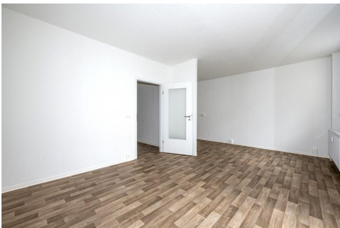
Innenaufnahme - Wohnen 1