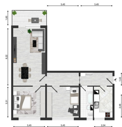
möblierter Grundriss - KI-generiert