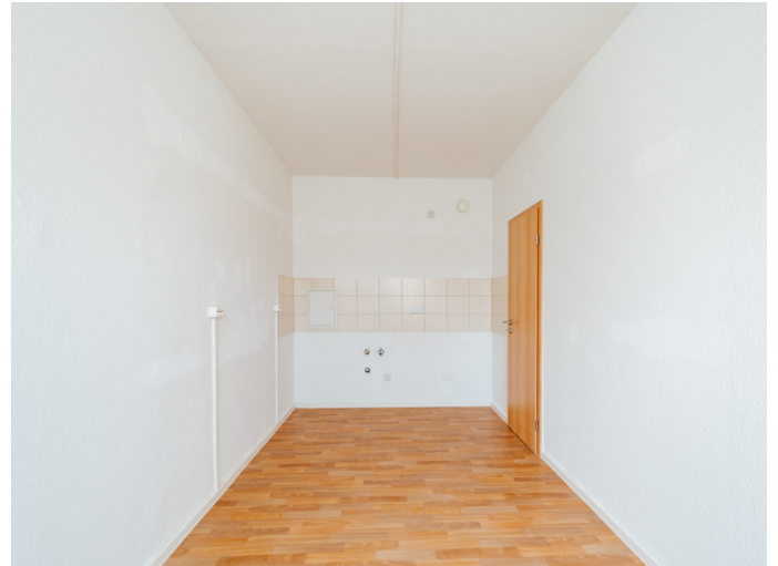
Die Stadtfelder Gneisenauring 18