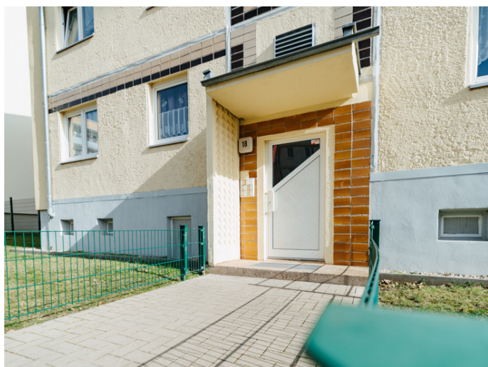
Die Stadtfelder Gneisenauring 18