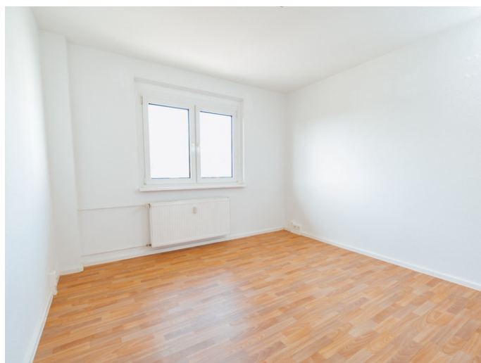
Die Stadtfelder Gneisenauring 18