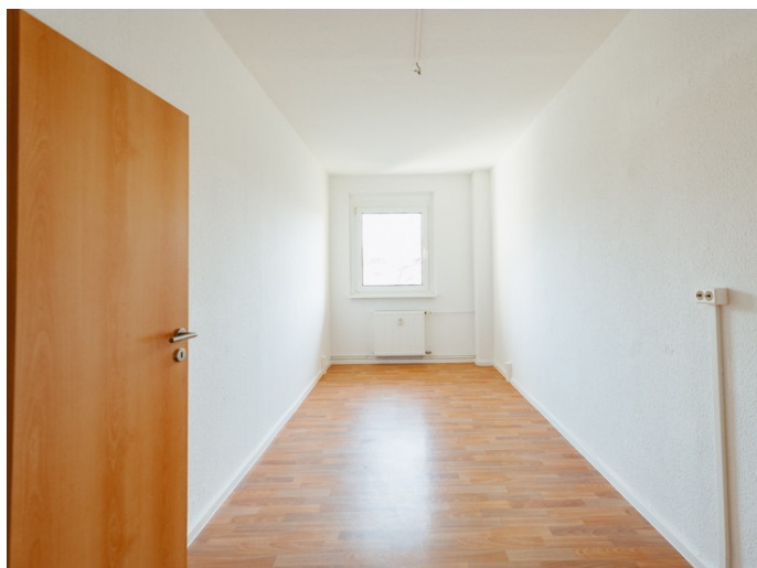
Die Stadtfelder Gneisenauring 18

Die Stadtfelder Wohnungsgenossenschaft eG | Peter-Paul-Straße 32 | 39106 Magdeburg