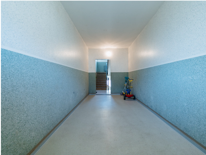
Die Stadtfelder Gneisenauring 18

Die Stadtfelder Wohnungsgenossenschaft eG | Peter-Paul-Straße 32 | 39106 Magdeburg