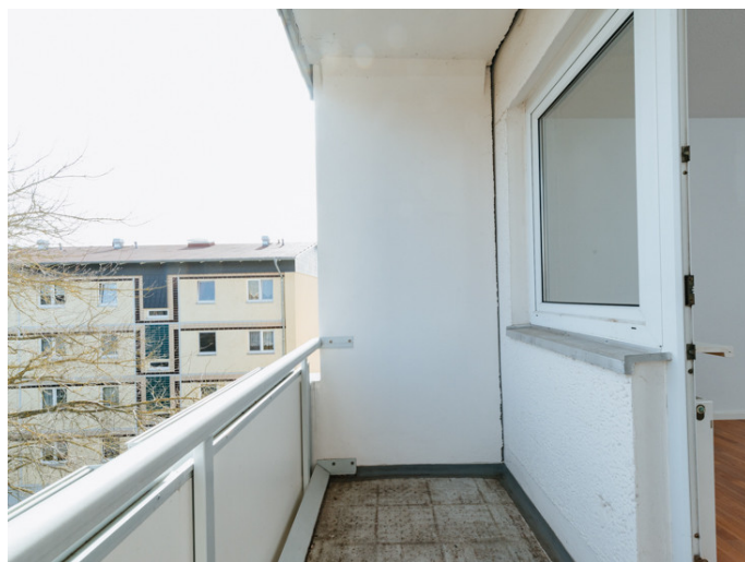
Die Stadtfelder Gneisenauring 18