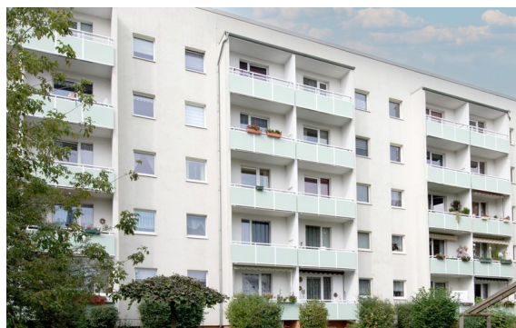
Hoch hinaus - Aktion Kaltmiete erlassen