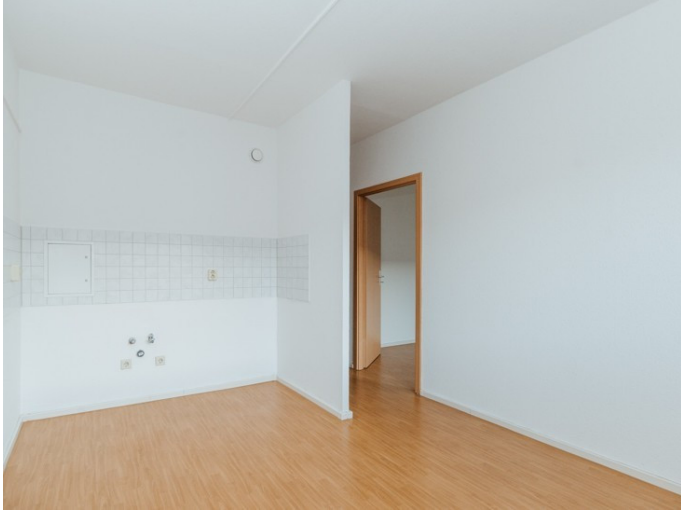
Musterfoto - Küche

Die Stadtfelder Wohnungsgenossenschaft eG | Peter-Paul-Straße 32 | 39106 Magdeburg