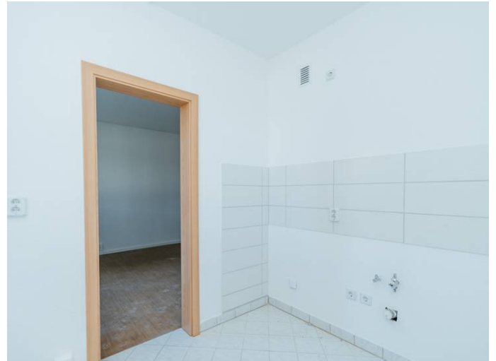
Die Stadtfelder Lumumbastr.24_1MR_105.141