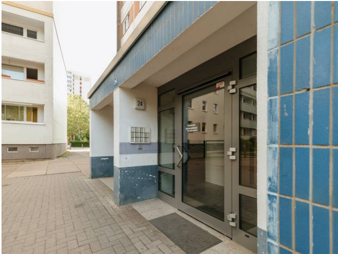
Die Stadtfelder Lumumbastr.24_1MR_105.141

Die Stadtfelder Wohnungsgenossenschaft eG | Peter-Paul-Straße 32 | 39106 Magdeburg