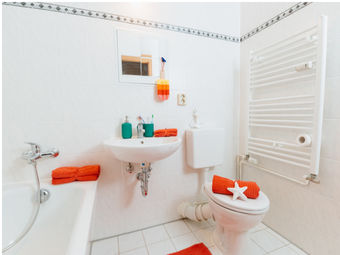
Bad mit Wanne