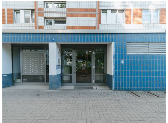
Die Stadtfelder Lumumbastr.24_1MR_105.141