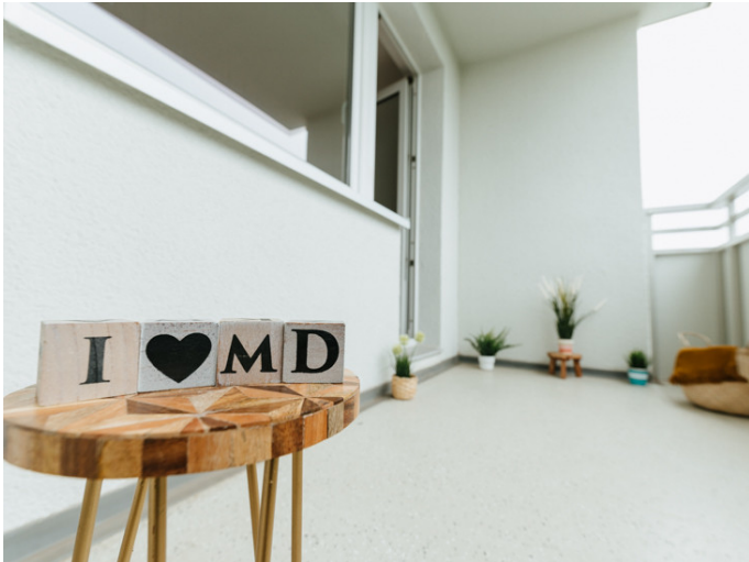
Kannenstieg Hans-Eisler-Platz.3 6MR Ihr neues Zuhause in Magdeburg

Die Stadtfelder Wohnungsgenossenschaft eG | Peter-Paul-Straße 32 | 39106 Magdeburg