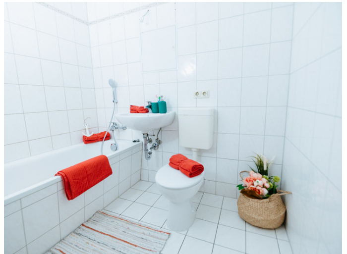
Altstadt Bahnhofstr. 42 6L