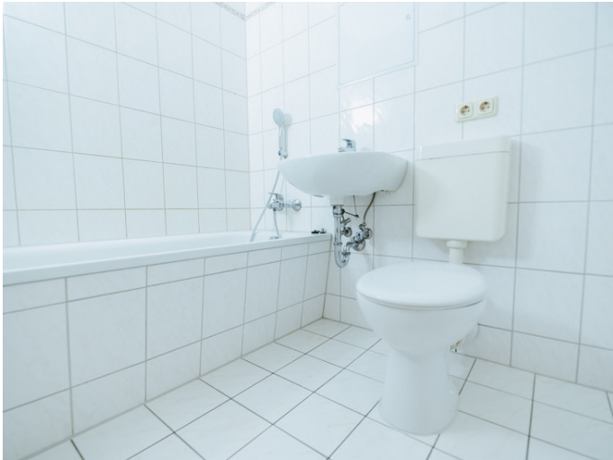
Altstadt Bahnhofstr. 42 6L

Die Stadtfelder Wohnungsgenossenschaft eG | Peter-Paul-Straße 32 | 39106 Magdeburg