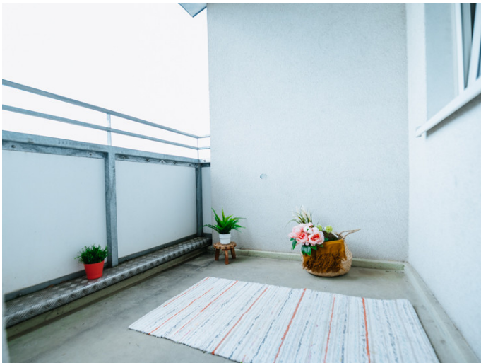
Altstadt Bahnhofstr. 42 6L