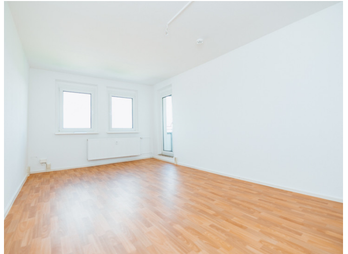
Altstadt Bahnhofstr. 42 6L