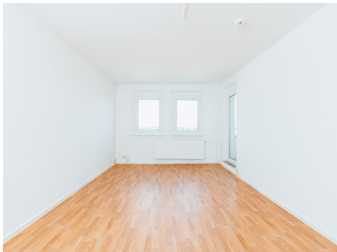
Altstadt Bahnhofstr. 42 6L

Die Stadtfelder Wohnungsgenossenschaft eG | Peter-Paul-Straße 32 | 39106 Magdeburg