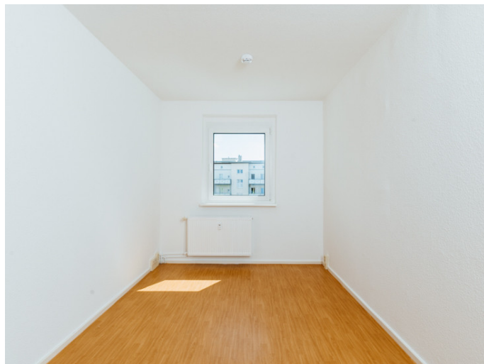
Altstadt Bahnhofstr. 42 6L