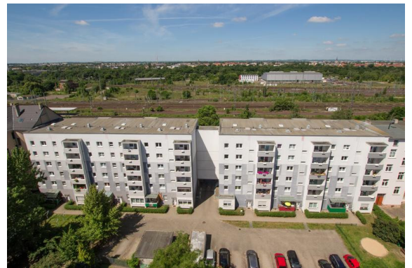
Bahnhofstraße 38-44 Außenansicht