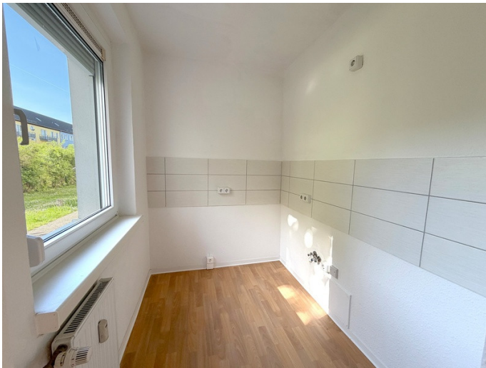
Küche mit Fenster