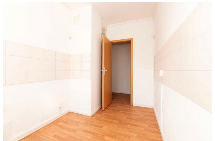
Genug Platz für Ihre Küchenzeile