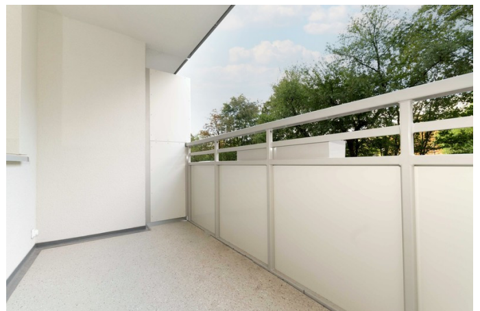
Ihr neuer Blick vom Balkon