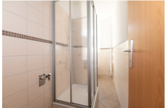
Das moderne Bad mit Dusche