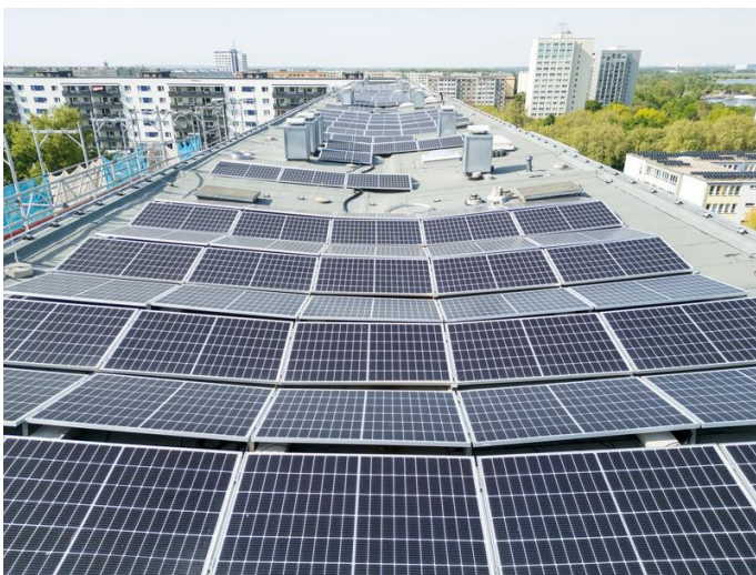
Lutbild - Photovoltaik, kurz PV-Anlage